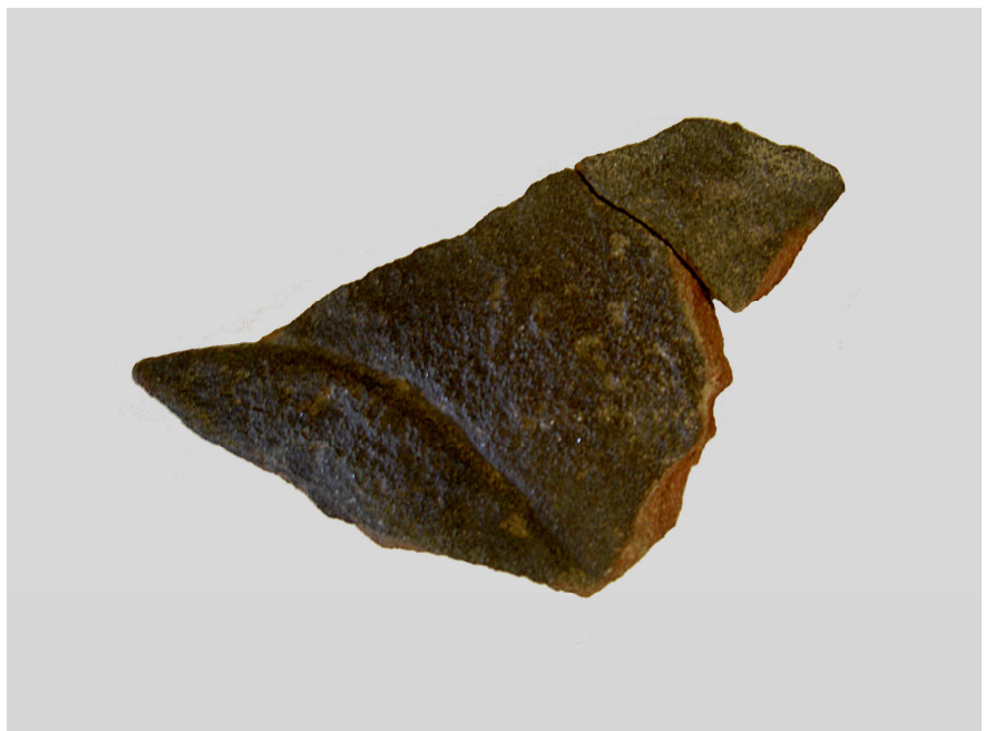
Bild 2. Uppsala, Fyristorg. Fragment B med resterna av en ornamentslinga.