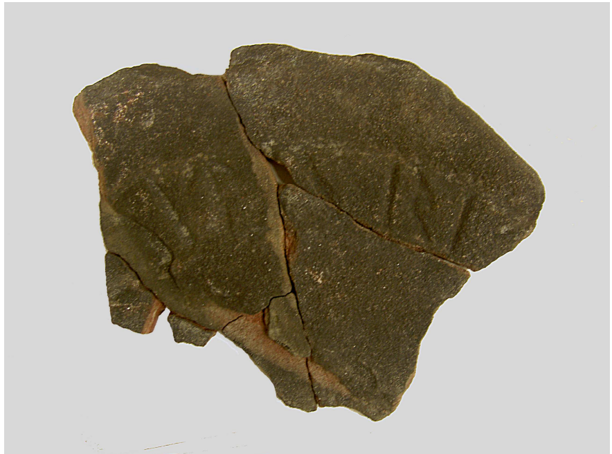
Bild 1. Uppsala, Fyristorg. Fragment A med runorna ...litu · rit...