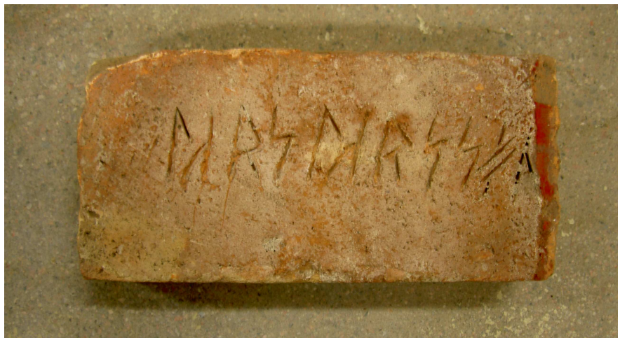
Bild 3. Tegelsten med en sentida runinskrift från Järnbrogatan, Uppsala.

Det råder ingen tvekan om att runinskriften är sentida. Eftersom runorna har ristats i den våta lera före bränningen rör det sig förmodligen om tegelslagarens namn.